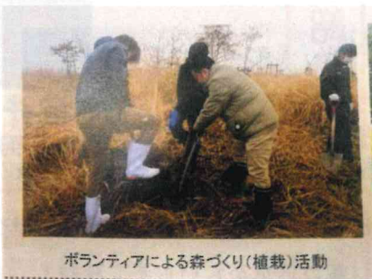
ボランティアによる森づくり(植栽)活動

本委員会では主に「有明海・八代海の環境の保全と水産資源の回復」「2050年熊本県CO2排出実質0」「再生可能エネルギー導入促進」に対する審議を行いました。今回私は「阿蘇地域太陽光抑制エリア」内に既に設置された太陽光パネルの更新について質問しました。執行部としては更新を拒絶することはできないが、任意で新たな設置を行わず撤去に協力するよう働きかける旨、またその為の予算確保の必要性が答弁されました。