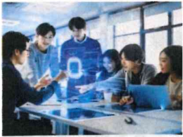
半導体学部半導体学科 (R7)